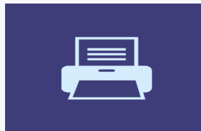
Технологии получения КИМ по сети Интернет, печати КИМ и сканирования бланков ответов в аудитории